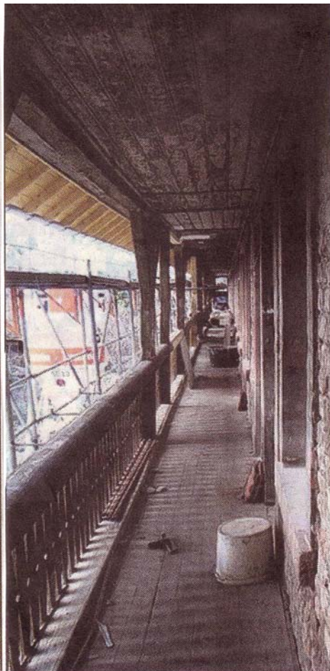
Die Laubgänge bleiben ebenfalls erhalten, wie vieles andere.