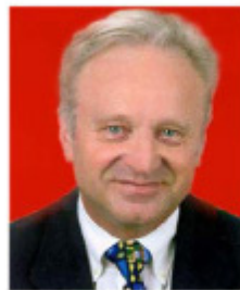
Lothar Mark, MdB

Wir wünschen allen Bürgerinnen und Bürgern ein schönes Weihnachtsfest und ein friedvolles und gesundes Neues Jahr