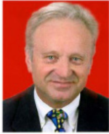
Lothar Mark, MdB